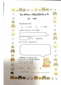
ブックウォーク宣言書(上)、認定書(下)