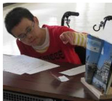
好きな写真を指さし説明する生徒