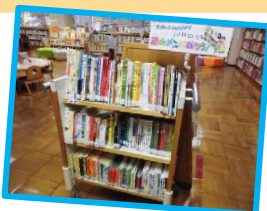
「読みメン」コーナー

「読みメン」とは、子どもに絵本を読む男性のこと。この言葉には、お父さんやおじいさんにも、もっと子どもと絵本を楽しんでほしいという願いが込められています。お父さんが絵本を読むことは、お子さんとの楽しみになることはもちろん、お母さんのゆとりの時間にもつながります。家族みんなが絵本でHAPPYに！！