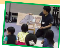
読みメンのおはなし会