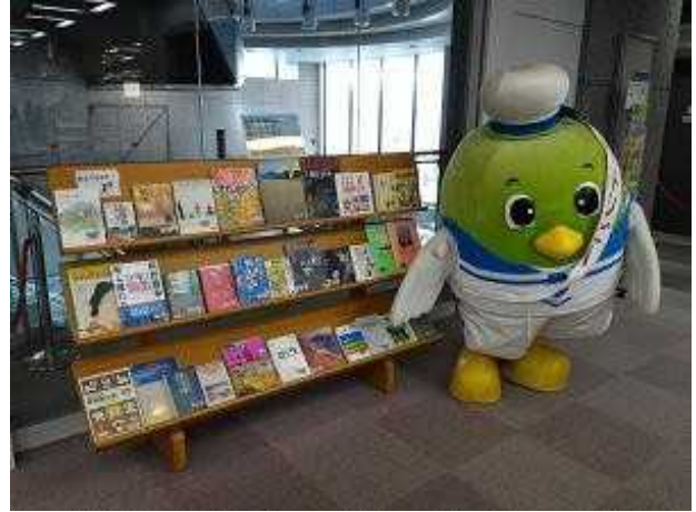
鳥取の関連図書コーナーを紹介するトリピー