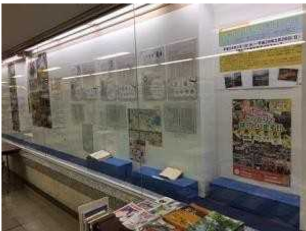
「鳥取の俳人を訪ねる旅～田中寒楼・阪本四方太・河本緑石～」展