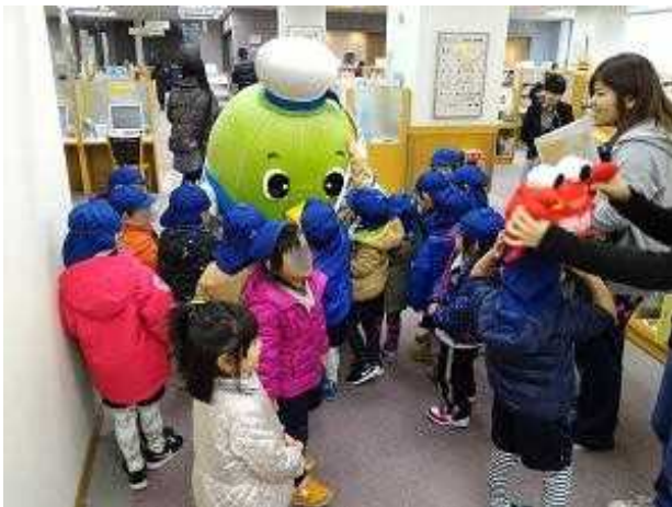
保育園児にもみくちやにされるトリピー