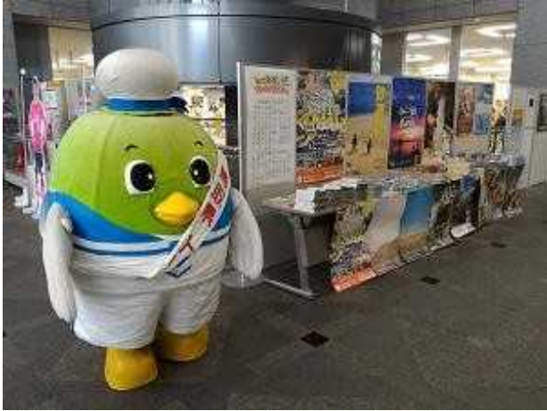
開館と同時に入館者を迎えるトリピー