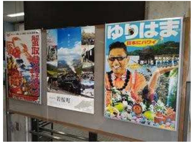
鳥取県に関連した図書展示のコーナー