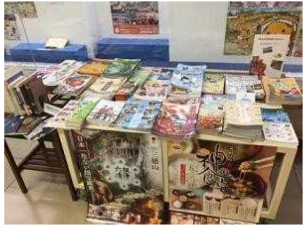
【山口市立中央図書館】