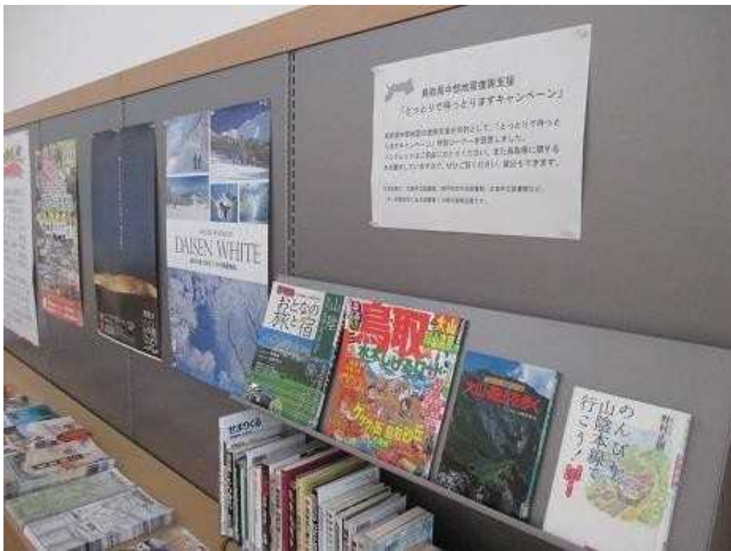
【神戸市立中央図書館】