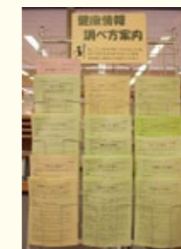
健康情報調べ案内

健康・医療について、手始めとなる基本資料や調べ方、相談内容などを紹介しています。 ※県立図書館のホームページでも見ることができます。