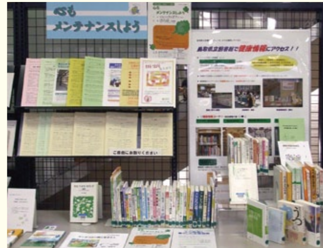
その都度テーマを決めて展示をしています