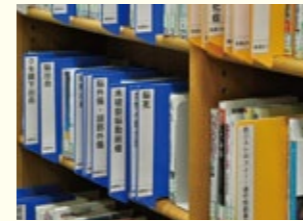
病名から闘病記を探せます。

全国最大規模 約1300冊 闘病記文庫には病気をどう捉え、病気とどう向き合って生きるかという「生き方情報」が綴られた本があります。