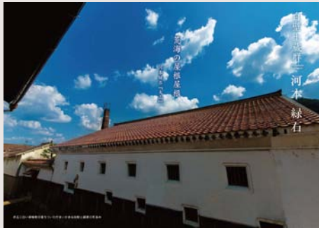
河本 緑石 宮沢賢治との交流で知られ、砂丘社で活躍した自由律俳人(現倉吉市出身)