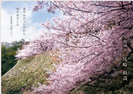
尾崎 放哉 「咳をしても一人」の自由律俳句で知られる「漂泊の俳人」(現鳥取市出身)

郷土出身文学者シリーズ特別編 『とっとり文学の情景』増補版 企画・編集 鳥取県立図書館 発行 平成30年3月