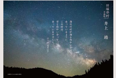
井上 靖 「通夜の客」には旧福栄村(日南町)の美しさを表現