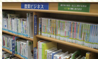
農業ビジネス関連本