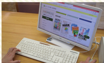
「ルーラル電子図書館」

このほか、新規就農関連、スマート農業関連などの農業ビジネスに役立つ本、『現代農業』『農業および園芸』などの農業関連雑誌も多数所蔵しています。様々な場面で広くご活用ください。本や雑誌は、市町村立図書館を通じて貸出もできます。