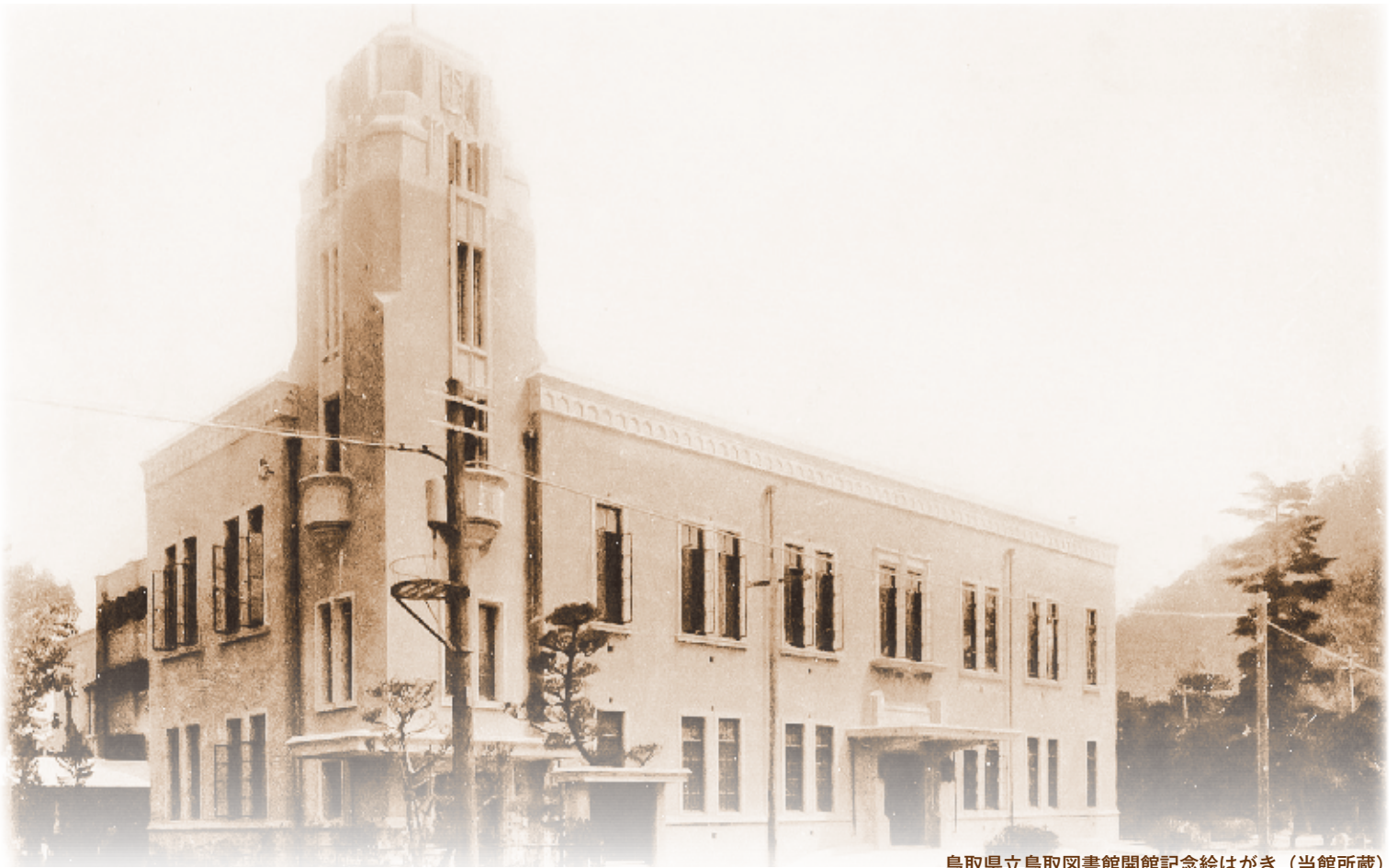
鳥取県立鳥取図書館開館記念絵はがき