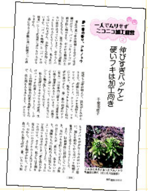
伸びすぎバケと硬いフキは加工向き(2010年5月号)