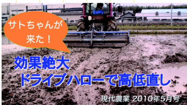
現代農業に掲載された名人農家の耕耘術をビデオで。本誌と一緒に見るとさらに納得。（現代農業取材ビデオ）

季節ごとの農作業のポイントから取扱説明書が見つからない中古農機の点検整備術まで。代替わり時代の悩みに応えるビデオクリップ集（1作品 1～4分）約200本を公開中。『現代農業』取材ビデオも収録。