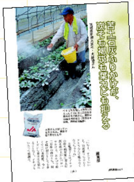
苦土石灰ふりかけが、炭そも褐斑も葉カビも抑える (2007年6月号)