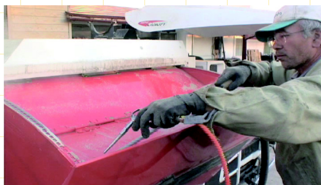
春先からは農薬散布のコツ。取れ秋にはコンバイン作業のコツ。年間通じて日々の作業のポイントがよくわかる。（すぐに役立つ旬のビデオ）