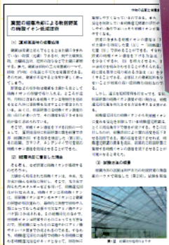
葉面の細霧冷却による 軟弱野菜の硝酸イオン 低減技術(土壌施肥編)