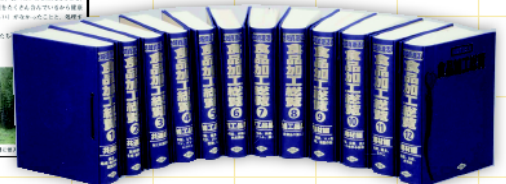
乾燥たけのこ(食品加工総覧)