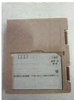
写真「音声デイジーの郵送箱、宛名カード」