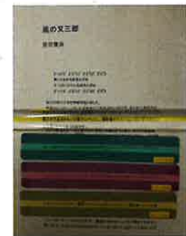
写真「リーディングトラック」