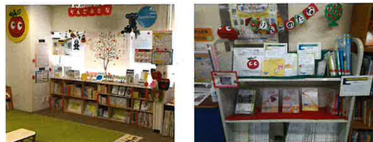
写真「豊島区立のりんごの棚」「久喜図書館子ども室のりんごの棚」